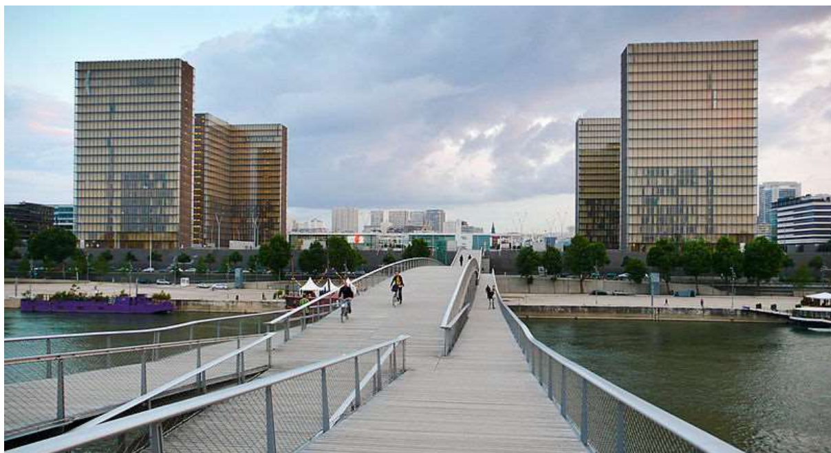
Obr. 15 Soubor čtyř výškových budov ve tvaru stojících napůl otevřených knih Francouzské národní knihovny v Paříži

nedemokratických zemích štědře financují výstavbu knihoven a využívají ji k propagaci režimu, popřípadě i k přikrášlování chudé kulturní historie národa, někdy až poněkud kýčovitě.