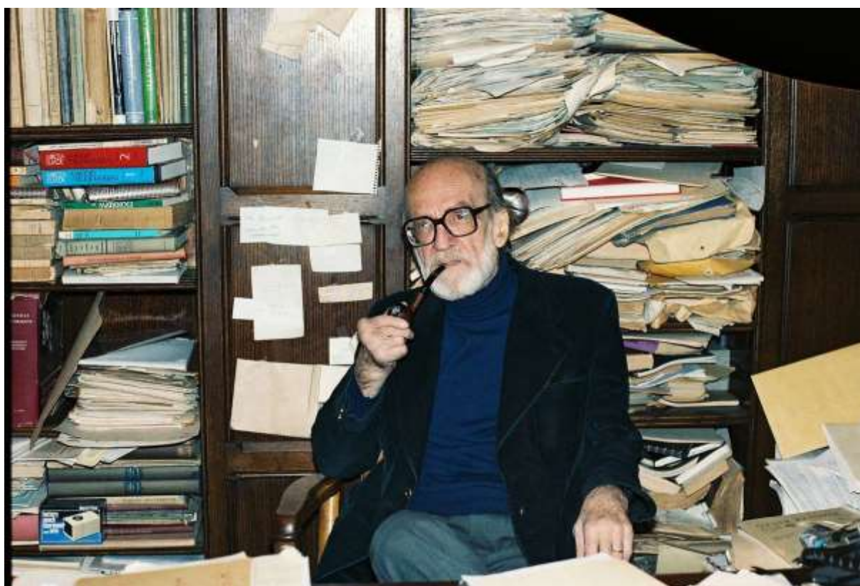
Obr. 5 Soukromá knihovna v pracovně mytologa, historika náboženství a spisovatele Mircea Eliade (1907 – 1986)