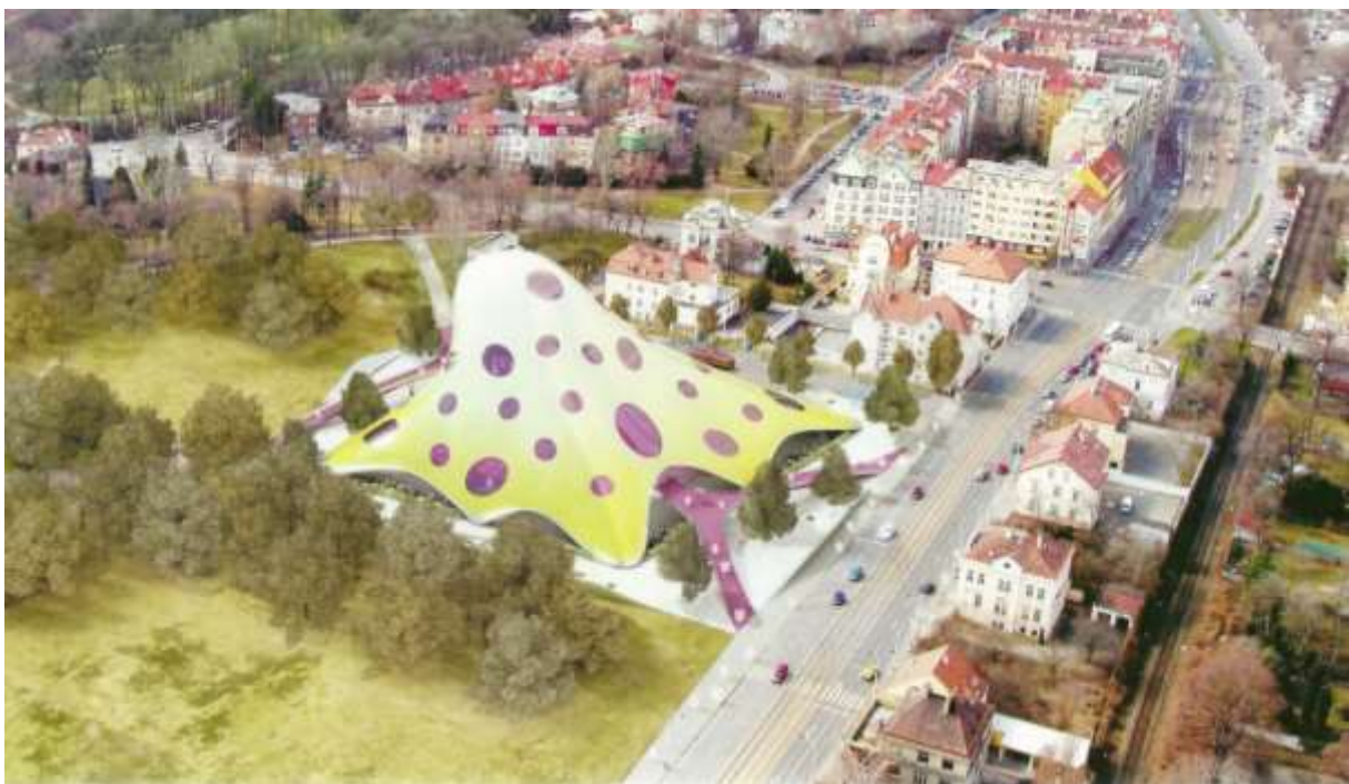
Obr. 23 Nerealizovaný projekt Národní knihovny České republiky v Praze na Letné 46