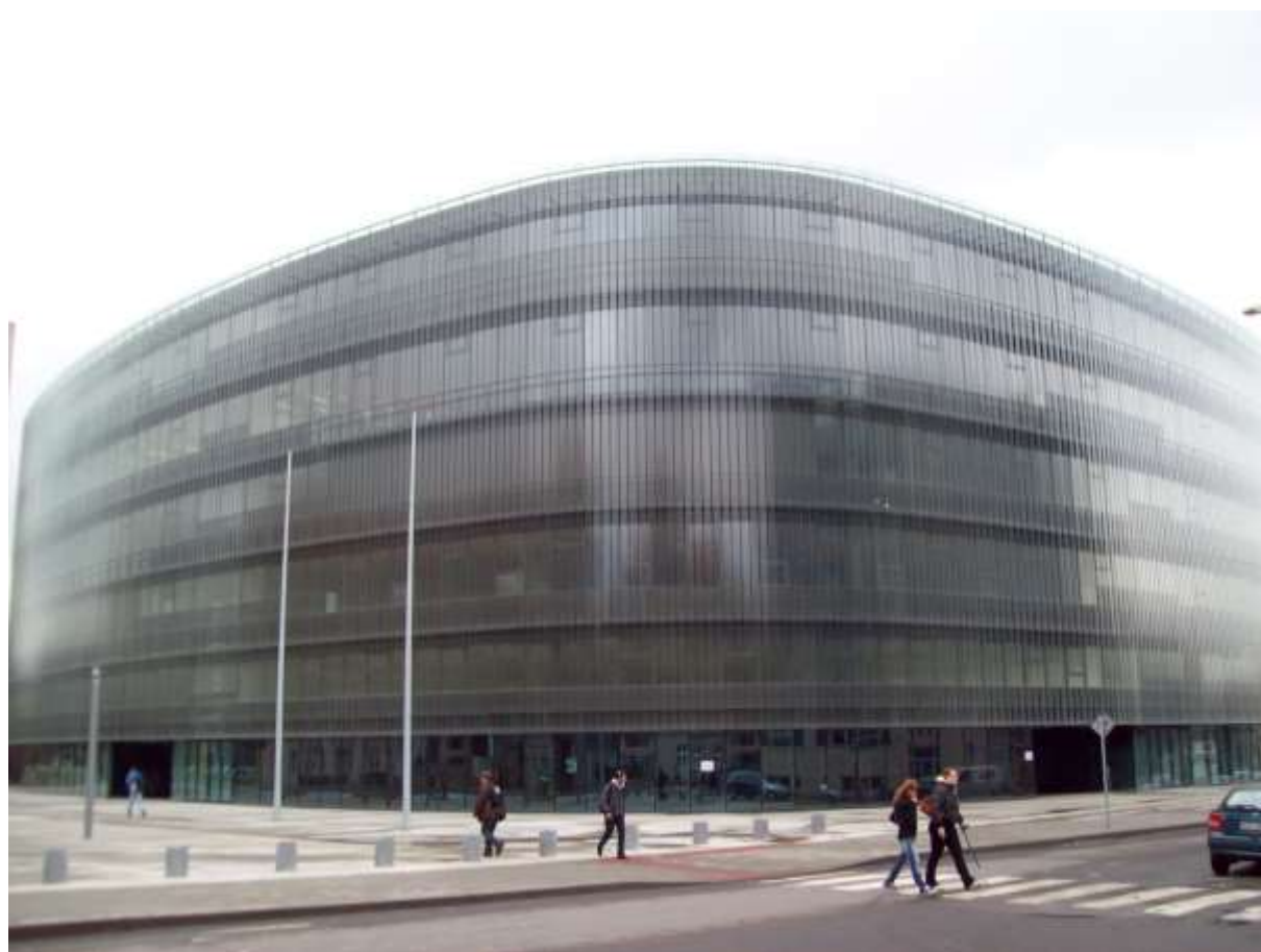
Obr. 25 Národní technická knihovna v Praze-Dejvicích

Dodejme jenom to, co zdůrazňovala již sama citovaná koncepce: hrozbou pro hladké plnění těchto funkcí je nezáměr státu a podfinancování; bohužel, podpora knihovní infrastruktury v České republice nesnese srovnání s rozvinutými demokratickými. Jednou z mála „výjimek potvrzujících pravidlo“ je novostavba Národní technické knihovny v areálu technických vysokých škol v Praze-Dejvicích.