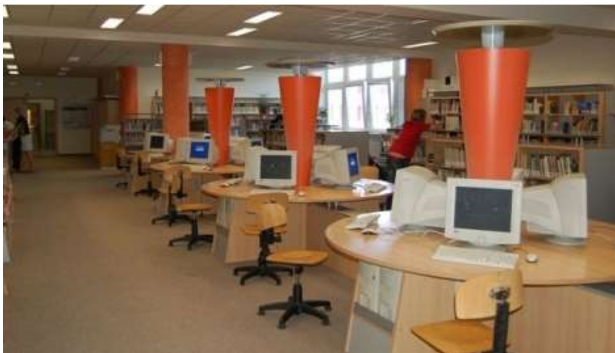
Obr. 24 Příklad menší knihovny vybavené pro přístup k internetu

Perspektivní špičkou ve sféře knihovnických a informačních služeb je poskytování informačních zdrojů pro výzkum. Příležitost lze spatřovat i v poskytování služeb v oblasti znalostních informací a poradenství.