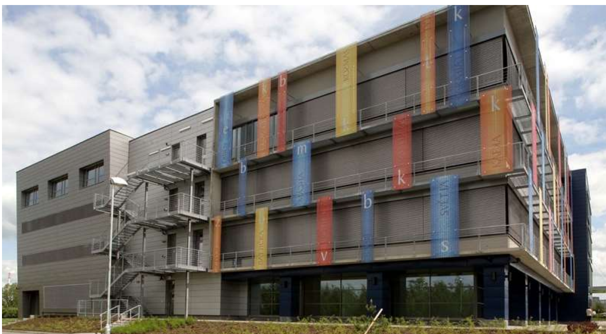
Obr. 30 Centrální depozitář Národní knihovny České republiky v Praze-Hostivaři 50