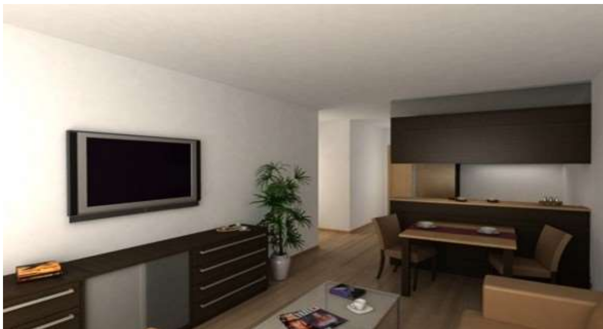
Obr. 7 Typická dispozice a zařízení rekonstruovaného bytu ve starším domě

posluchačem, komunikuje prostřednictvím mobilu a na sociálních sítích; užitečné či zajímavé informace vyhledává na internetu.