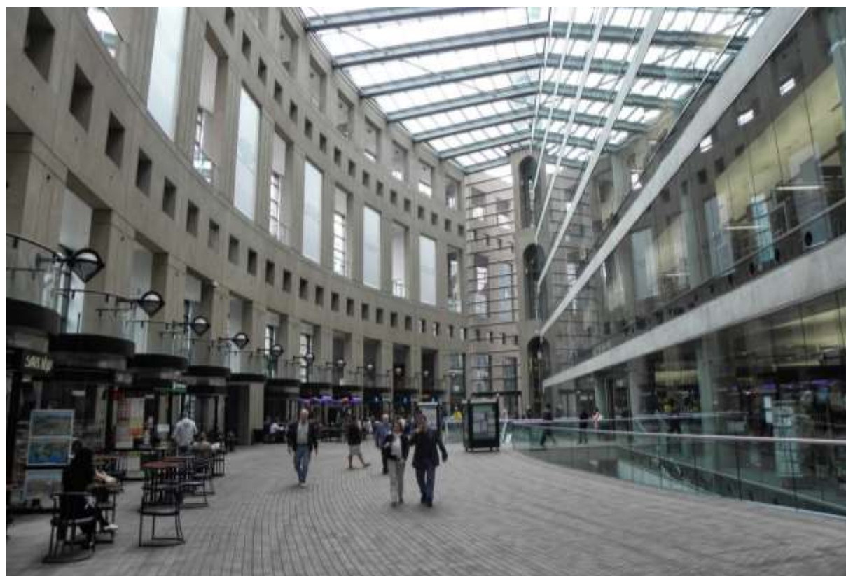
Obr. 10 Foyer veřejné knihovny v kanadském Vancouveru