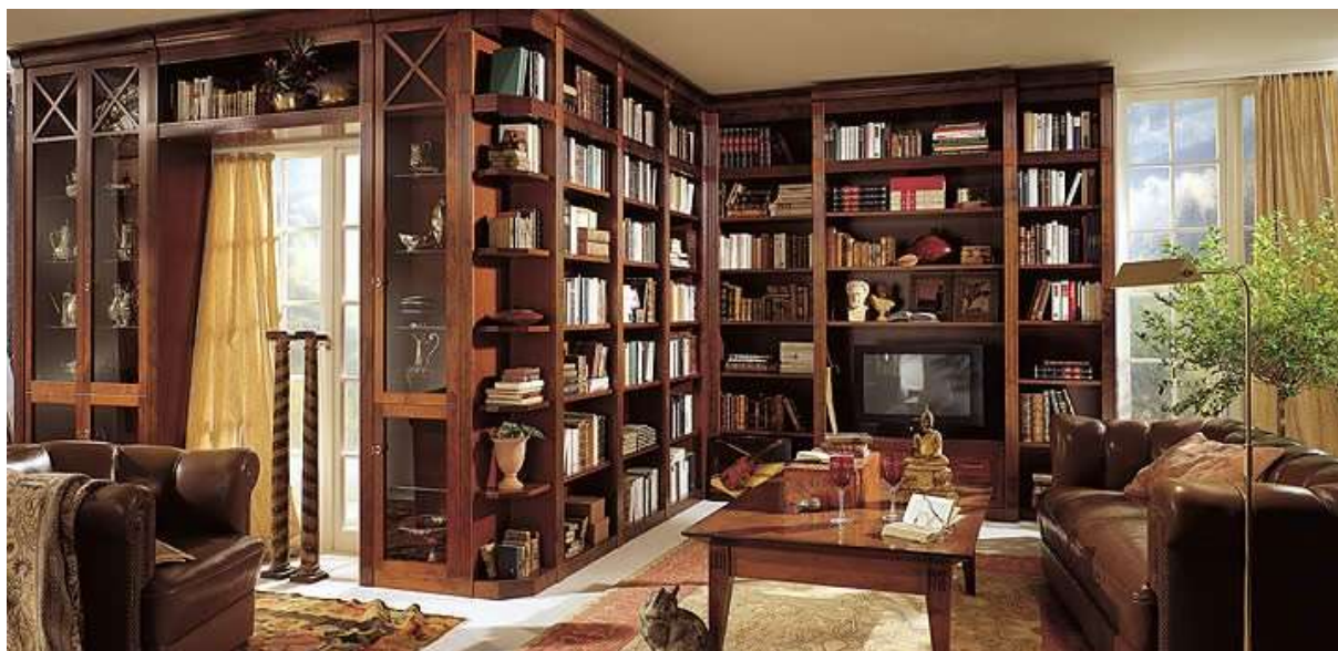
Obr. 4 Soukromá knihovna v současném bytě

funkcí je budit zdání vzdělanosti a kulturnosti majitele. Skutečně používaná pracovní knihovna intelektuála vypadá zpravidla zcela jinak.