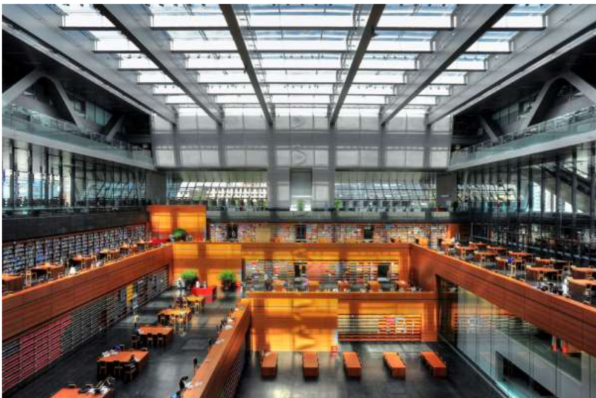
Obr. 18 Hlavní hala Čínské národní knihovny v Pekingu