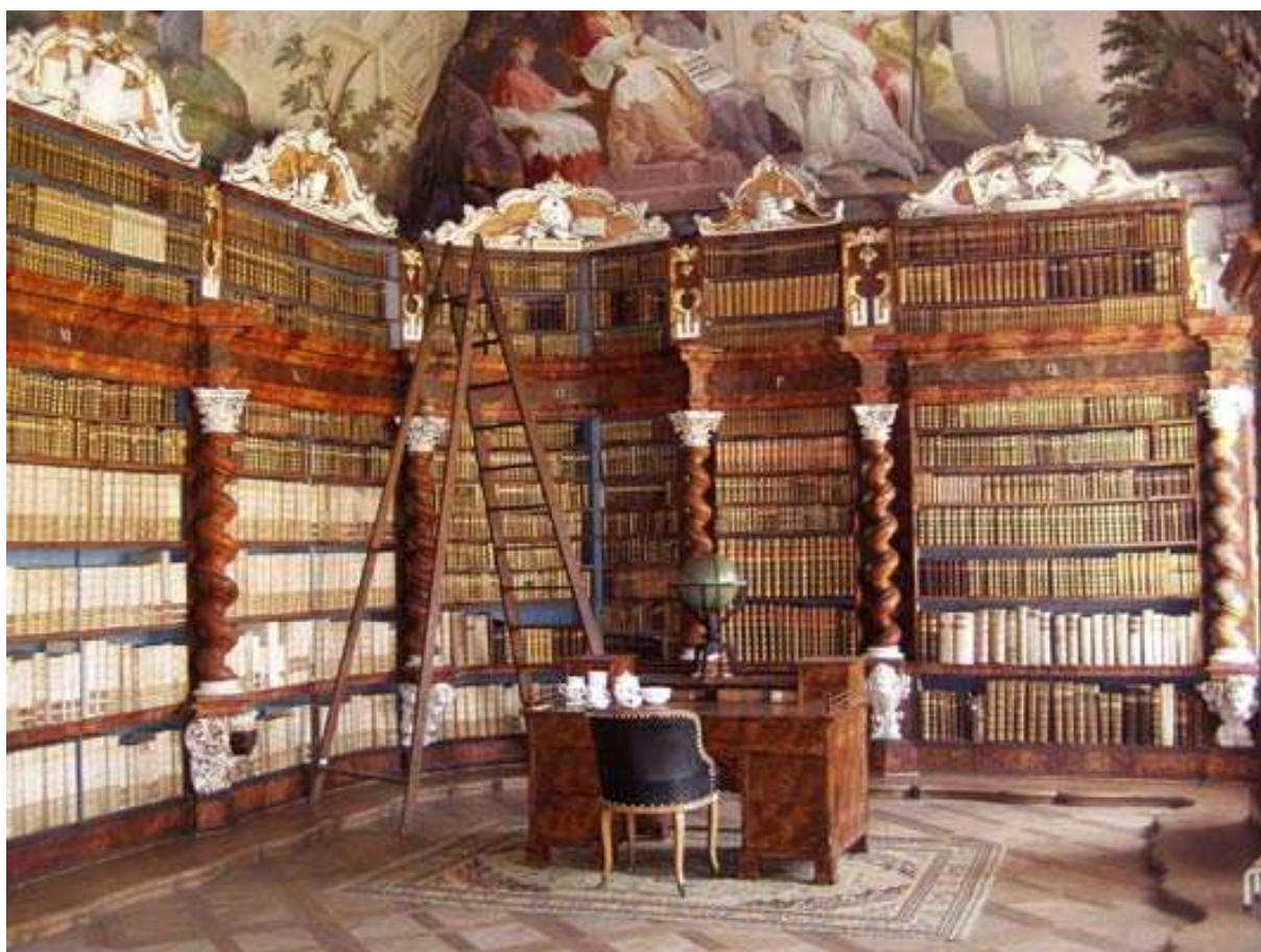
Obr. 1 Klášterní knihovna premonstrátů v Nové Říši se 14 tisíci svazků

„Vstupme do velkého sálu staré knihovny. Překvapí nás smělá architektura klenby, oslní bohatá štuková výzdoba nebo ilusivní prostor nástropních fresek; konečně nás upoutá rytmus vyřezávaných a pozlacených skříní nebo prostých regálů. Pozorujeme nekonečné řady knih a pojednou se nás zmocňuje docela zvláštní pocit, jakého nepoznáme v žádném z palácových nebo zámeckých sálů, ba ani v chrámových prostorách. Stojíme před tichými svazky, v nichž je zachycen a uložen vývoj vzdělanosti lidského ducha, lidské snahy po pravdě, kráse a dobru.“ 1