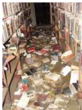
Obr. 29 Klementinum jako příklad lokality knihovny ohrožované povodněmi