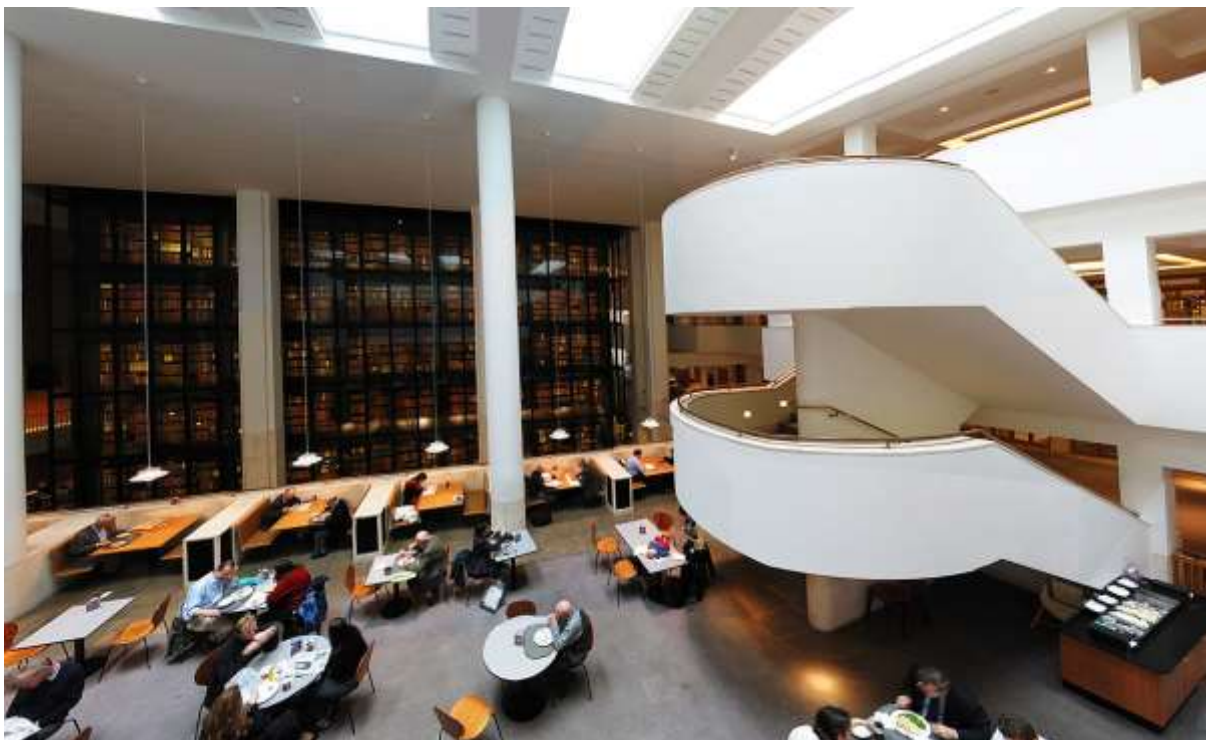
Obr. 11 Stravovací služby v Britské národní knihovně v Londýně

Tento směr vývoje může být ohrožen nedostatečnými finančními zdroji pro další rozvoj knihoven s negativním dopadem na dostatek kvalifikovaných pracovníků (knihovníci jsou u nás jednou z vůbec nejhůře odměňovaných profesí) a na schopnost knihoven uspokojit očekávání jejich uživatelů. Chybným krokem by bylo hledání východiska v komercionalizaci knihoven v duchu manažerského způsobu myšlení, jenž se prosazuje i ve sféře kultury; komercionalizace by vedla ke ztrátě postavení veřejné služby a k narušení principu rovného přístupu k informačním zdrojům prostřednictvím knihoven.