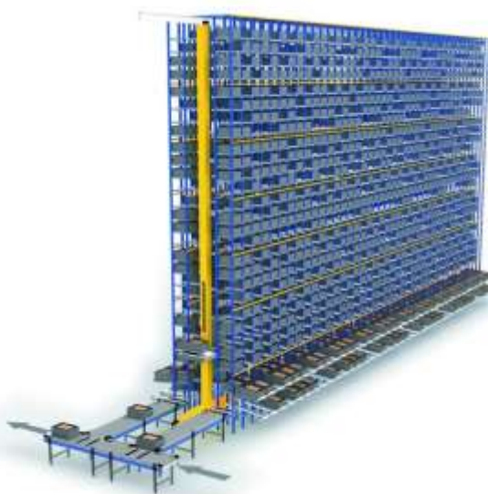
Obr. 12 Regálový zakladač v automatizovaném skladu knihovny (vlevo) 42 , řešení přenesené ze systému „Miniload“ pro výškové sklady drobného kusového materiálu (vpravo). 43