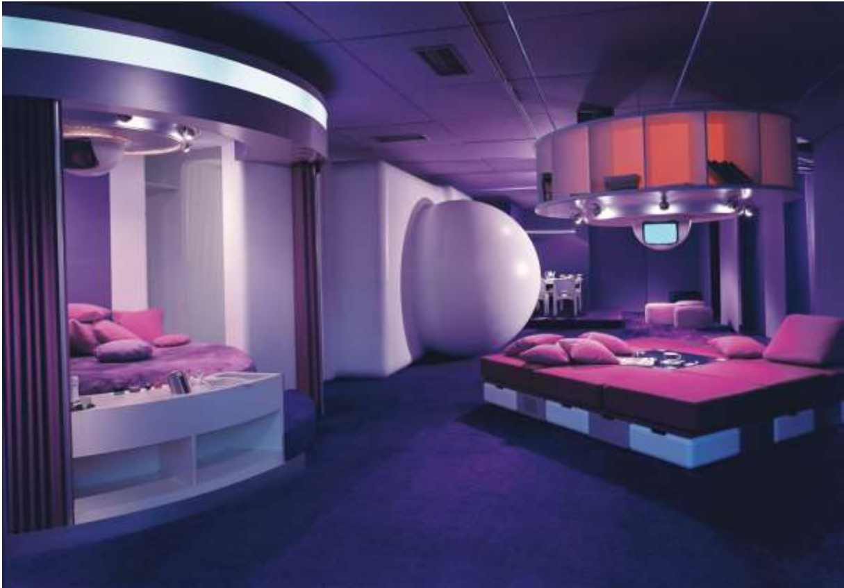
Obr. 6 Visiona, autor Joe Colombo

Jistým náznakem toho byly futurologické studie bytových architektů z konce 60. let minulého století, jako Visiona Itala Joe Colomba, do jisté míry předjímající vývoj informačních a komunikačních technologií: nad všemi buňkami obytného prostoru svítily televizní obrazovky, avšak místo pro knihy bylo takřka jen symbolické.