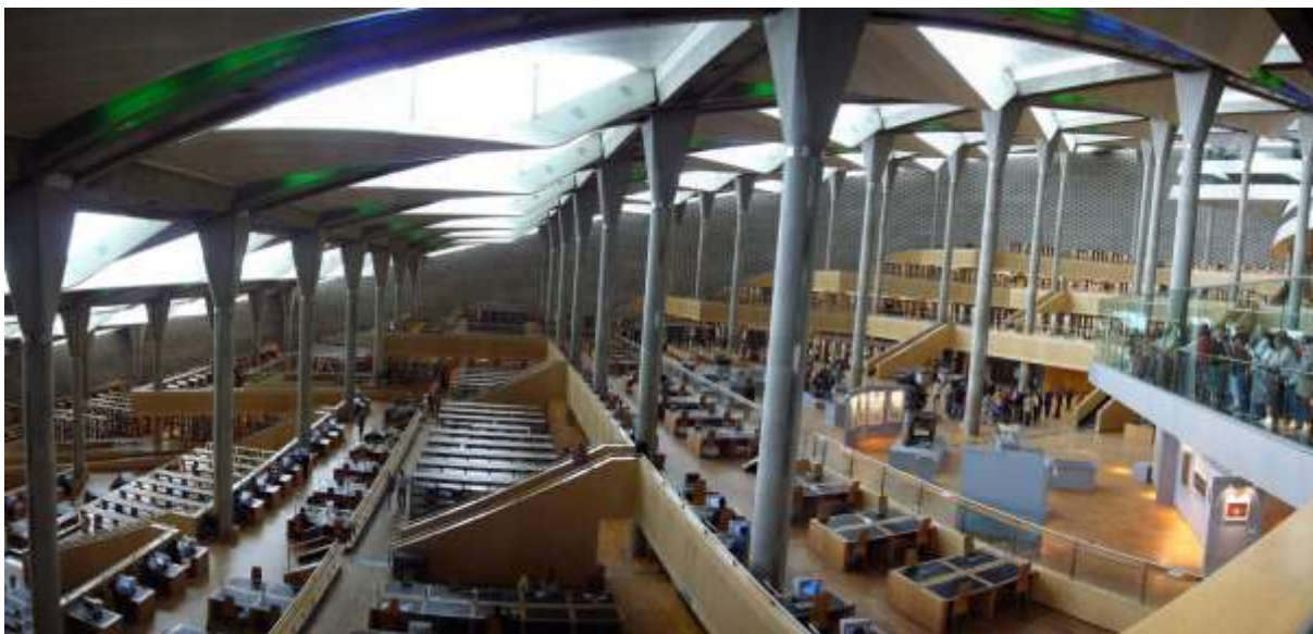
Obr. 19 Egyptská národní knihovna v Alexandrii