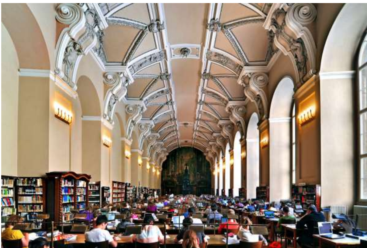
Obr. 28 Klementinum, všeobecná studovna