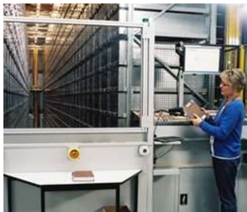
Obr. 13 Manipulace s ukládacími bednami na místě výdeje z automatizovaného zakladačového skladu knihovny Macquarie University v Austrálii 44

Pro řízení automatizovaného skladu knihovny může být převzat Warehouse Management System včetně záměnného způsobu skladování, při němž se – na rozdíl od tradičního uspořádání skladu knih do tematicky vymezených oddělení (zón) – ukládací bedny s knihami zaskladňují do nejbližších volných buněk v regálech, přičemž všechny obsazené a volné pozice jsou v paměti řídicího počítače.