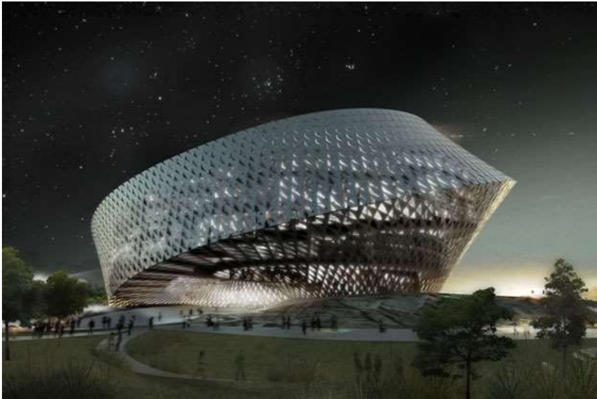
Obr. 22 Projekt Kazašské národní knihovny v Astaně