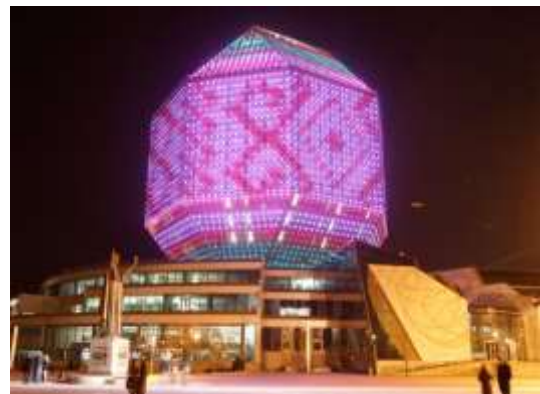
Obr. 21 Běloruská národní knihovna v Minsku

Národní knihovny nejsou jen „výkladní skříní“ kulturnosti, ale, objektivně vzato, mají největší prostorové nároky, neboť poskytují bohaté základní a specializované služby pro uživatele i pro ostatní knihovny, provozují nejrozsáhlejší systémy a databáze celostátního významu a provádějí největší objem koordinačních, odborných, informačních, vzdělávacích, analytických, výzkumných, standardizačních a metodických poradenských činností v systému knihoven; mají právo povinného výtisku a povinnost trvalého uchování tohoto fondu.