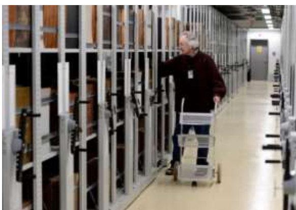
Obr. 14 Policové a přesuvné regály v centrálním depozitáři Národní knihovny České republiky v Praze-Hostivaři

Vyspělé země na knihovnách nešetří. Jak historické, pečlivě udržované, tak nové knihovny bývají architektonickou dominantou širokého okolí, chloubou, ale i jednou z vítaných příležitostí, jak do jinak vylidňujících se center velkoměst přivést život. Rovněž vlády v