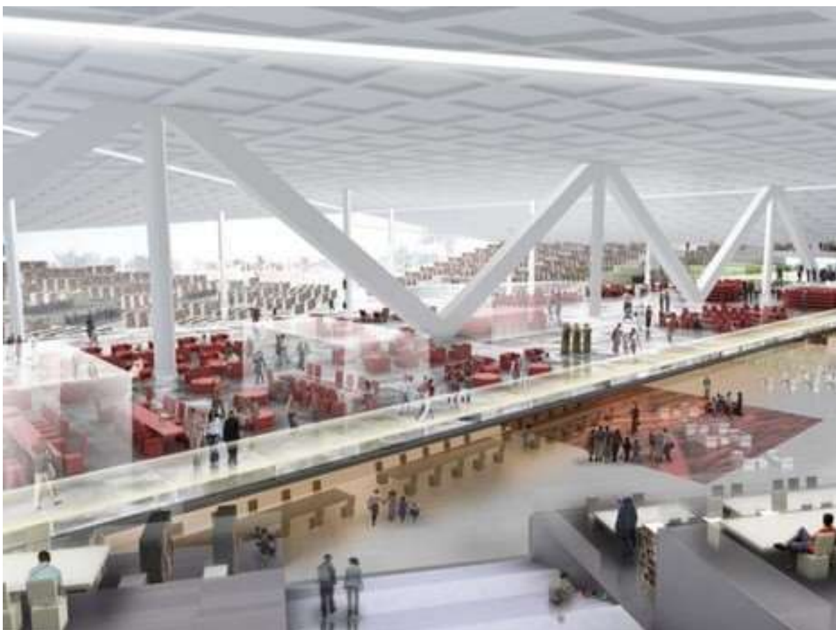
Obr. 20 Projekt nové národní knihovny Kataru 45