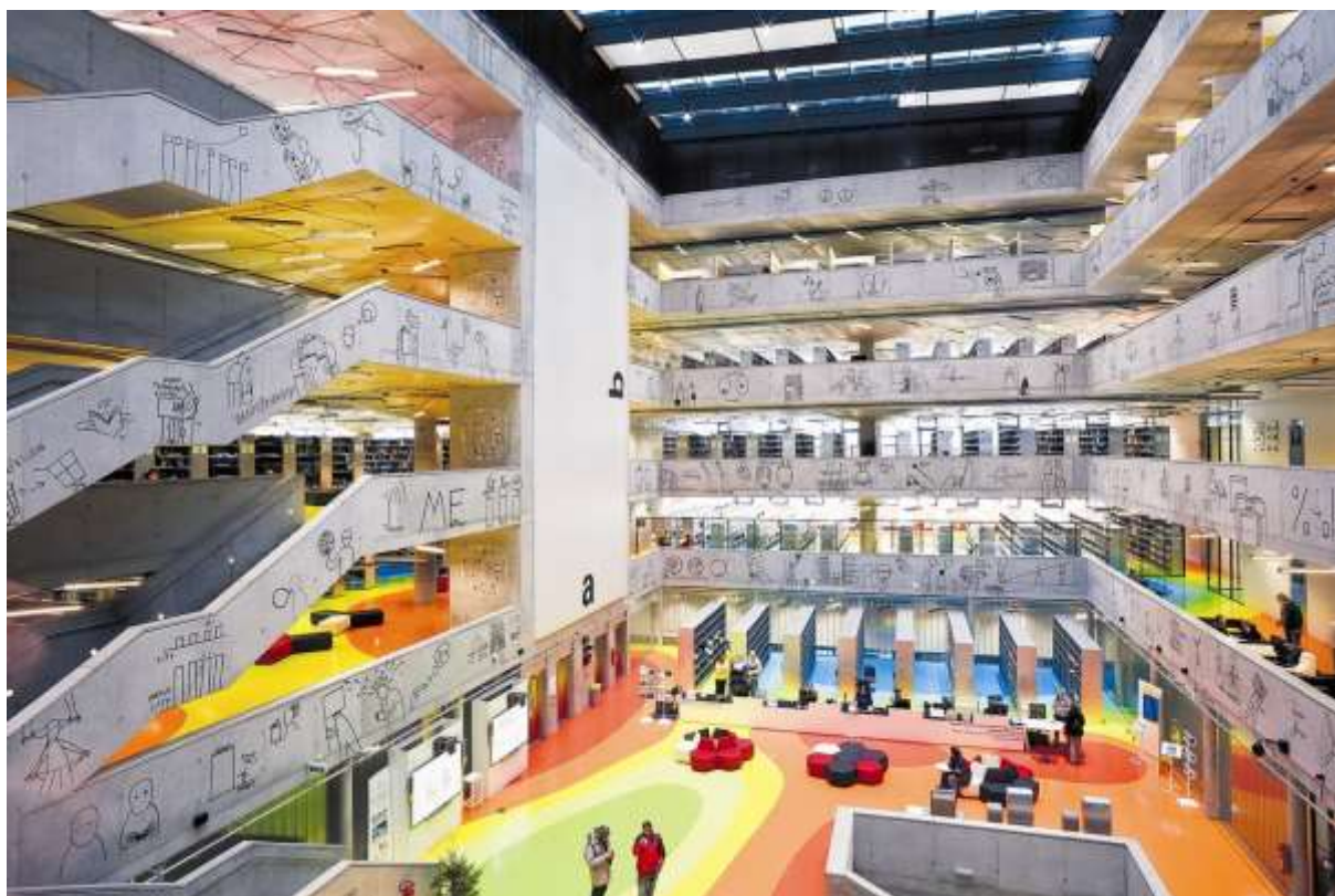
Obr. 26 Hala Národní technické knihovny v Praze-Dejvicích

Přesunutí technické knihovny z barokního Klementina do nové budovy umožnilo jeho revitalizaci pro Národní knihovnu České republiky, která si v něm ponechává historické a hudební fondy, novodobé fondy, Slovanskou knihovnu, Knihovní institut, studovny, veřejné čítárny a sály; revitalizace zahrnuje, kromě oprav fasád a renovace nádvoří, vybudování podzemních parkovacích garáží, přednáškového sálu, galerie, knihkupectví a kavárny.