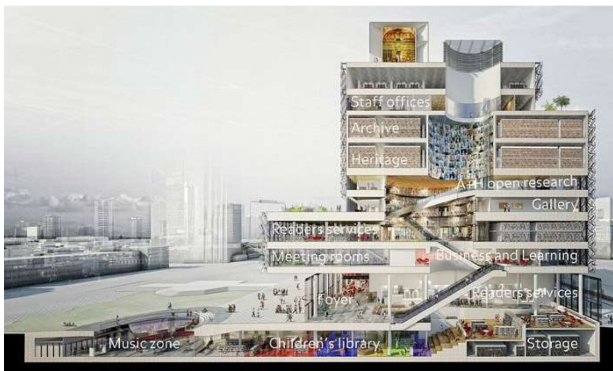
Obr. 9 Řez polyfunkčním objektem veřejné knihovny v Birminghamu

služeb vyžaduje logistické zajištění, ne nepodobné menšímu nákupnímu či kongresovému centru.