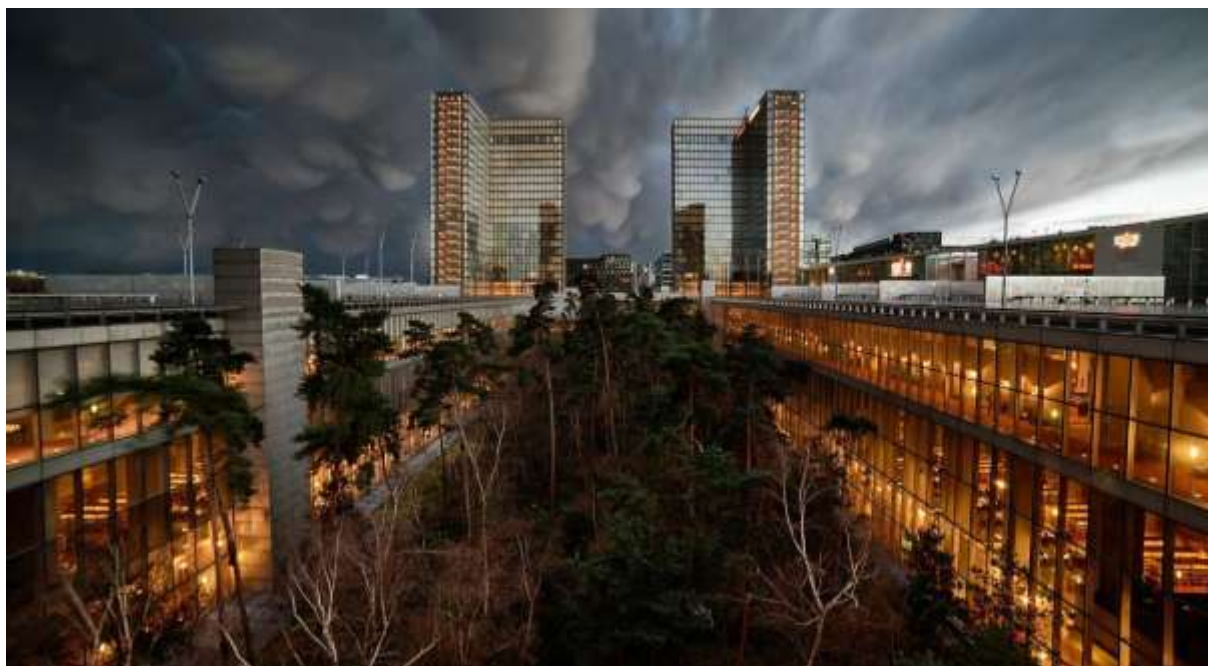
Obr. 16 Velkoryse koncipované prostory v podnoží téže knihovny