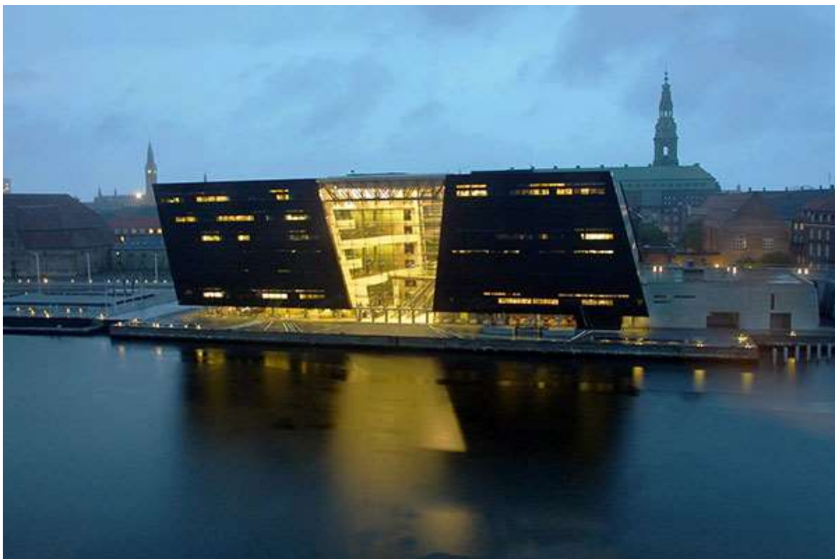
Obr. 17 Dánská národní knihovna v Kodani