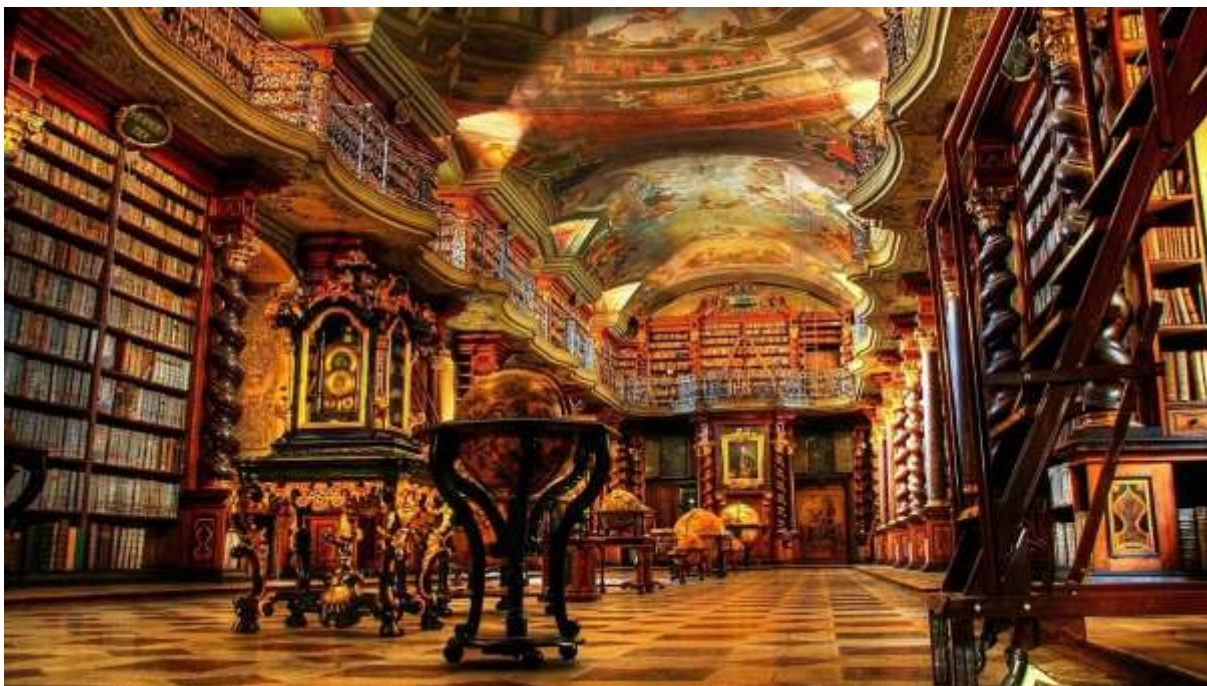
Obr. 27 Klementinum, historický sál knihovny