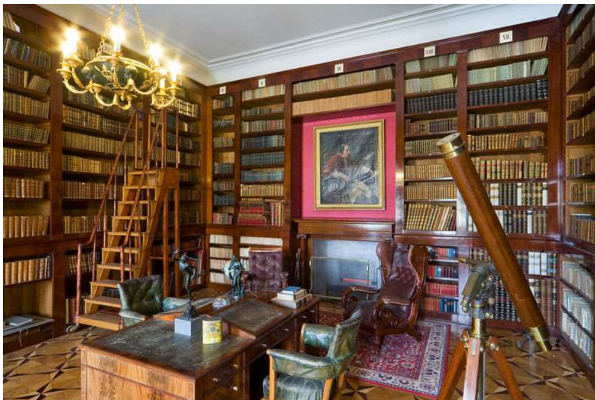
Obr. 3 Knihovna kancléře Metternicha o 30 tisících svazků na zámku Kynžvart

V této souvislosti je užitečné připomenout proměnu povahy knih z klášterního (chrámového) pokladu, jímž byly vzácné, ručně opisované a bohatě iluminované liturgické knihy, zejména antifonáře, popřípadě z luxusních předmětů osobní potřeby, jakým byly knihy hodinek, tedy z kultovních předmětů, v nástroj praktického poznání či zábavy, ze vzácných předmětů výsostně kulturního poslání v předměty hromadné výroby a obchodu, ve zboží; tato pozvolná proměna byla důsledkem rozšíření knihtisku. 5 Zlevňování knih umožnilo vznik soukromých knihoven ve šlechtických sídlech, významného statutárního symbolu; příkladem může být zámek Kynžvart.