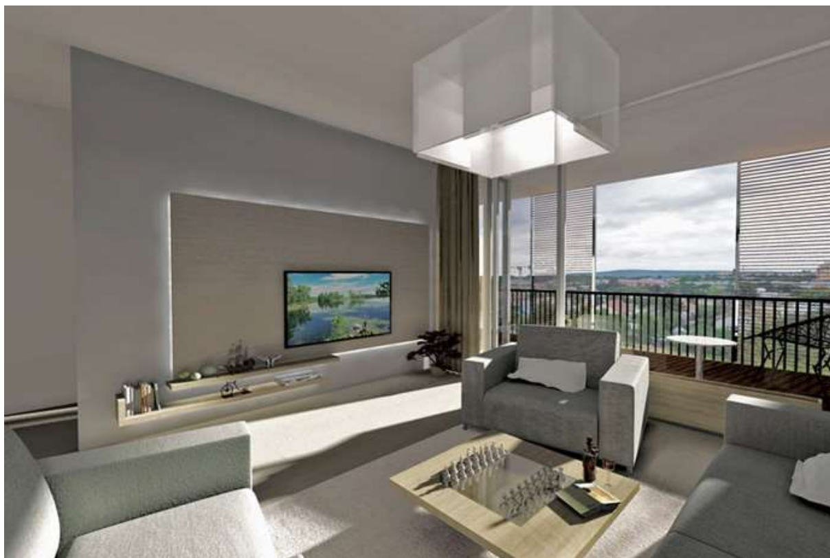
Obr. 8 Vybavení bytu v novostavbě audiovizuální technikou